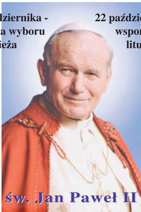
św. Jan Paweł II

16 października - rocznica wyboru na papieża